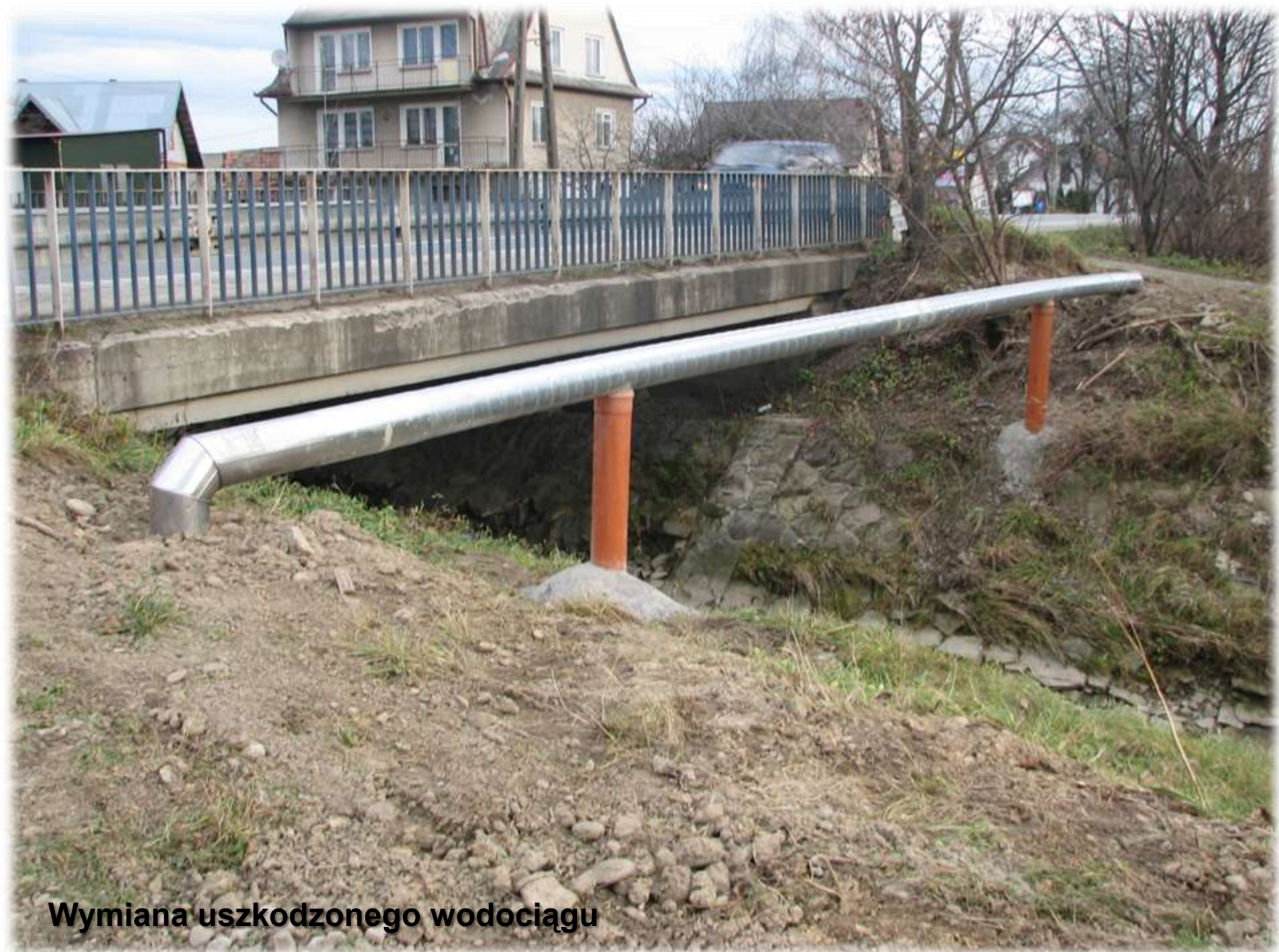
Wymiana uszkodzonego wodociągu