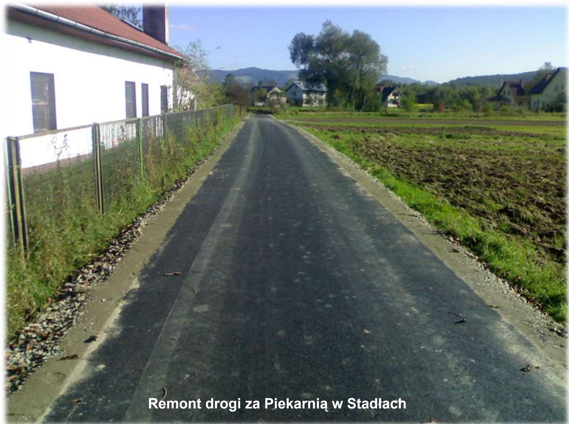
Remont drogi za Piekarnią w Stadłach