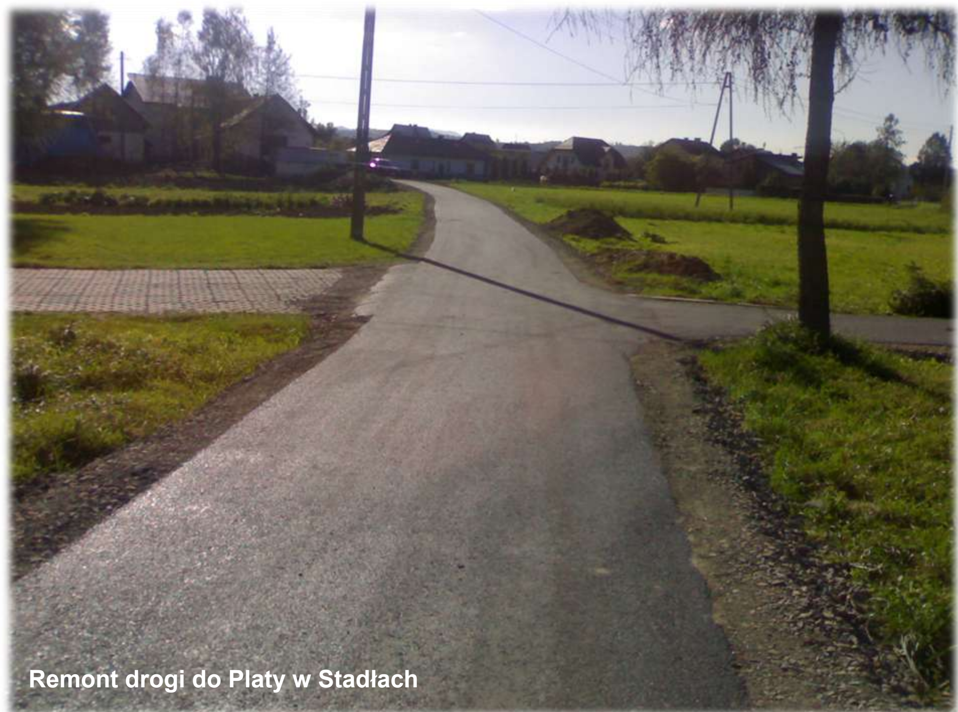
Remont drogi do Platy w Stadłach