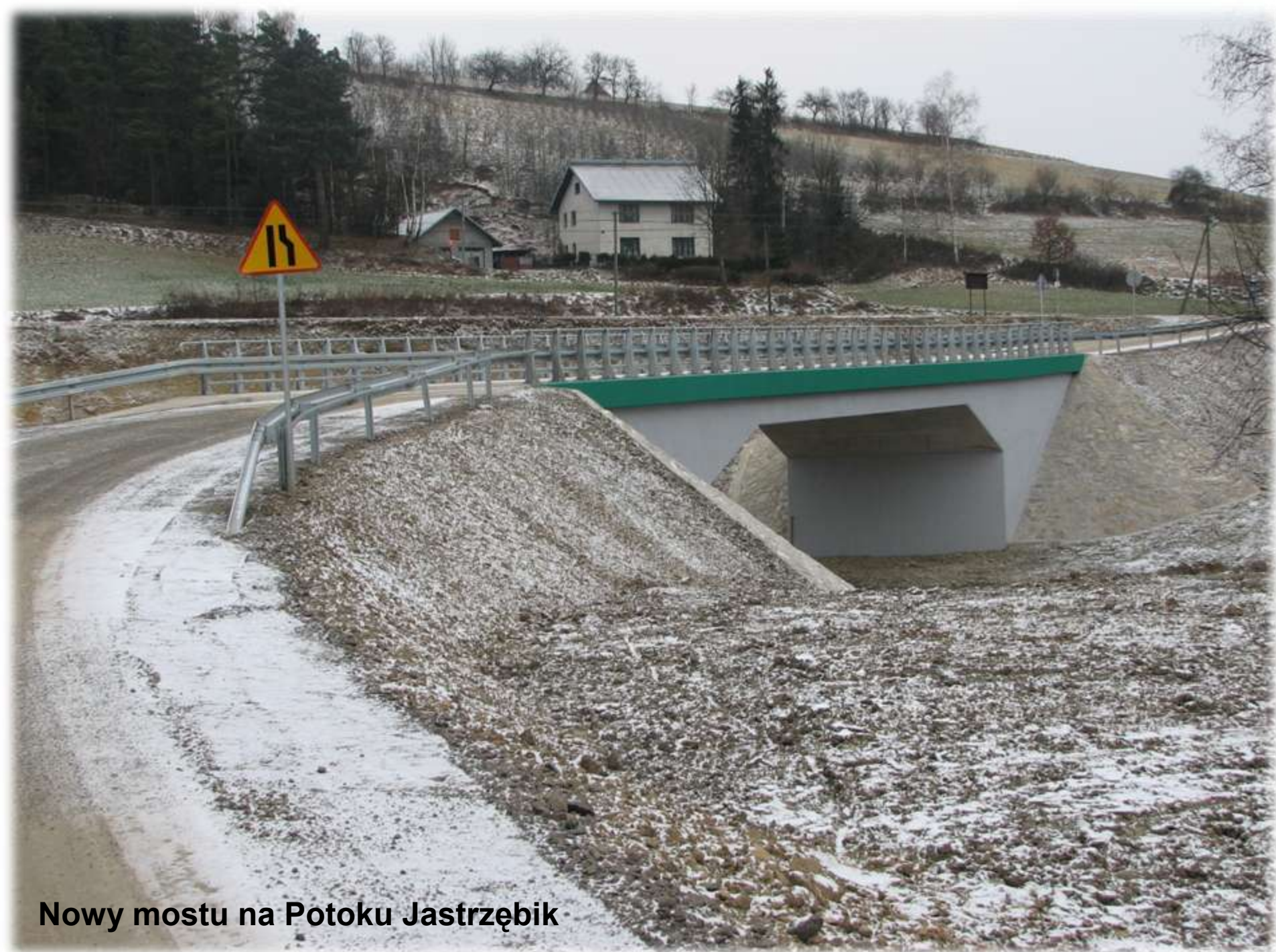
Nowy mostu na Potoku Jastrzębik