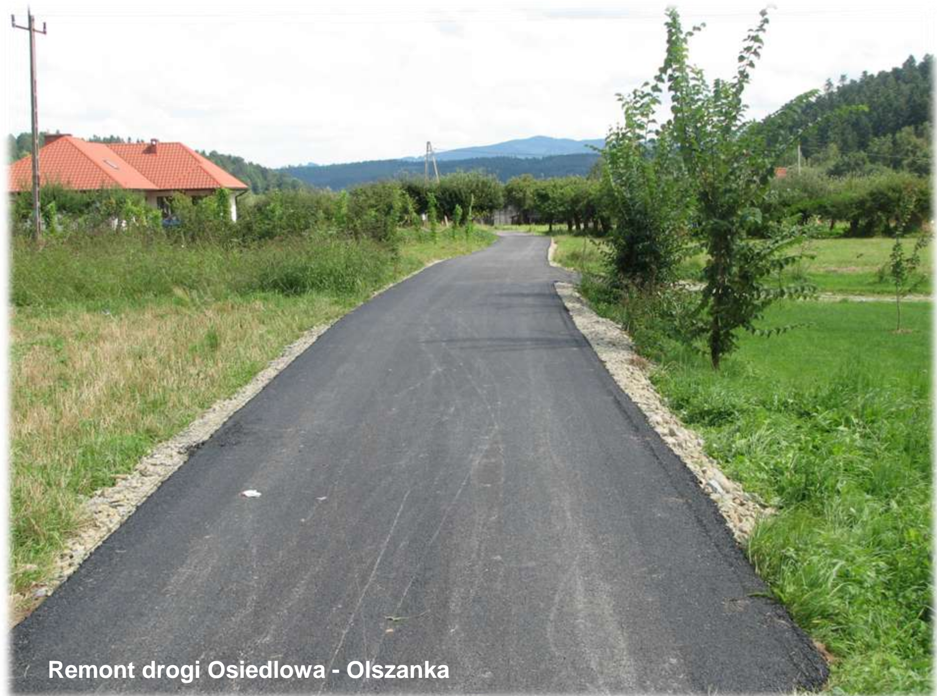
Remont drogi Osiedlowa - Olszanka