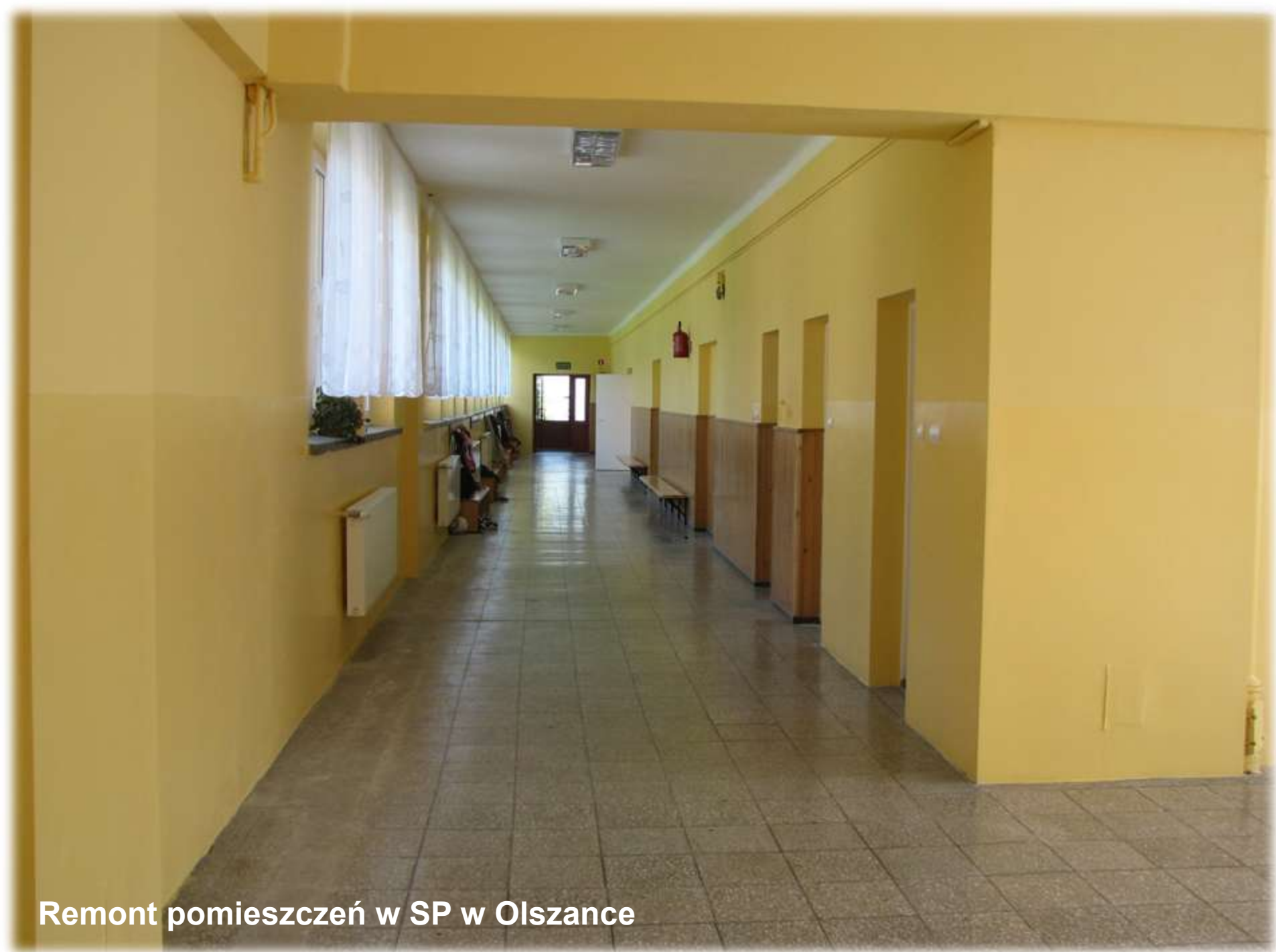
Remont pomieszczeń w SP w Olszance