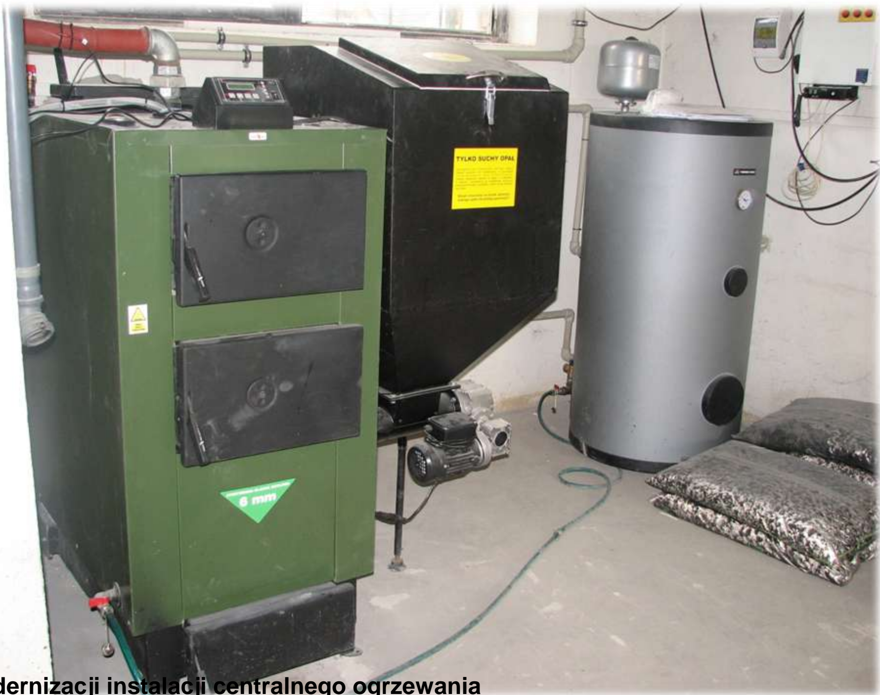
Modernizacji instalacji centralnego ogrzewania