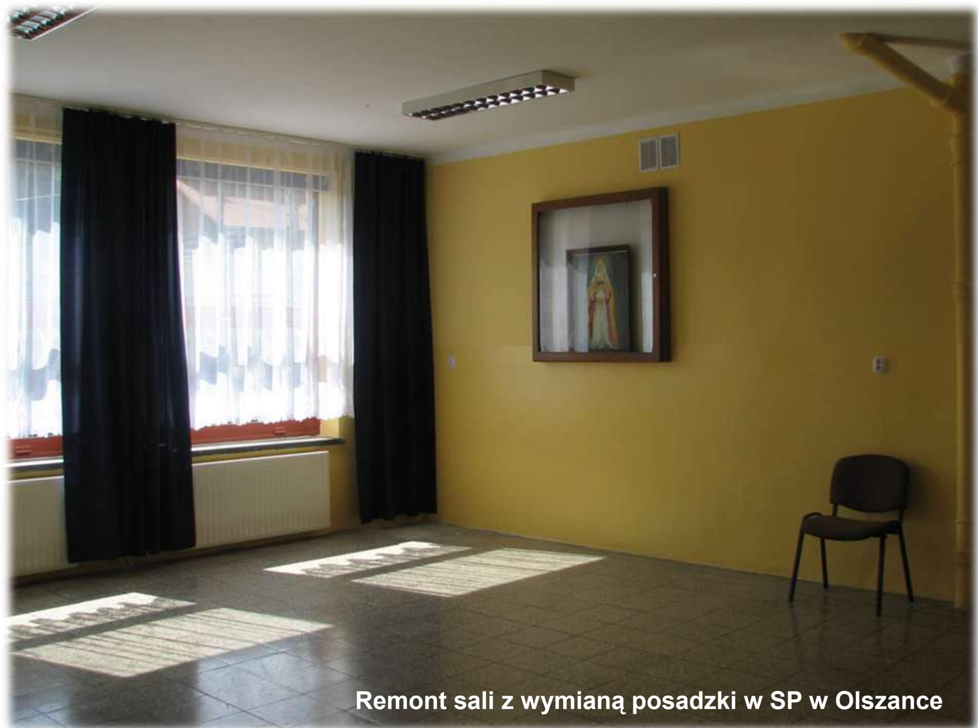
Remont sali z wymianą posadzki w SP w Olszance