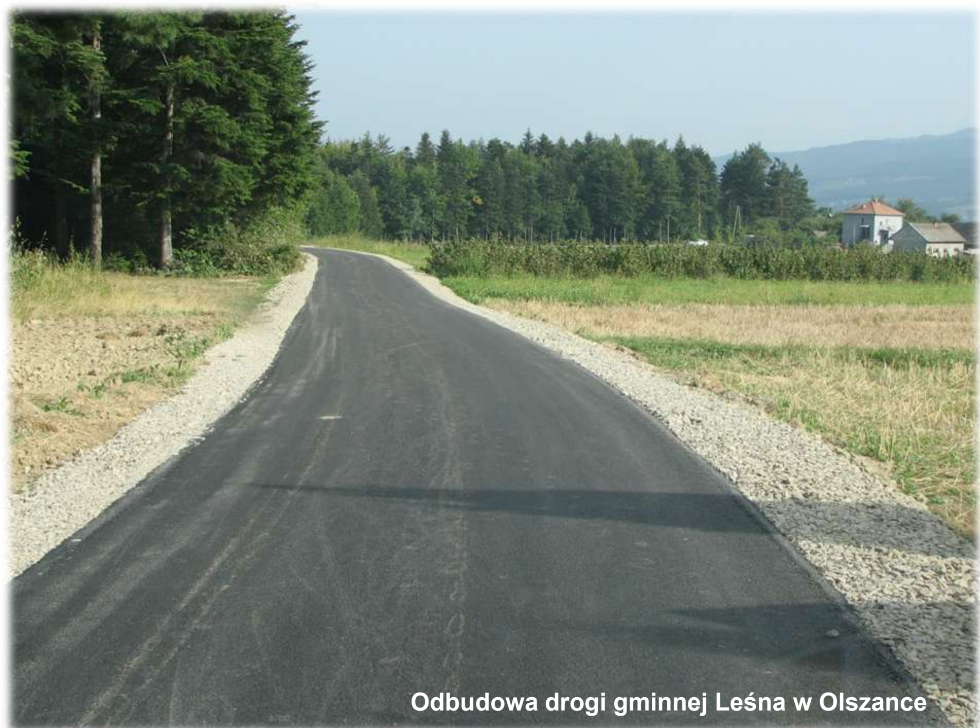
Odbudowa drogi gminnej Leśna w Olszance