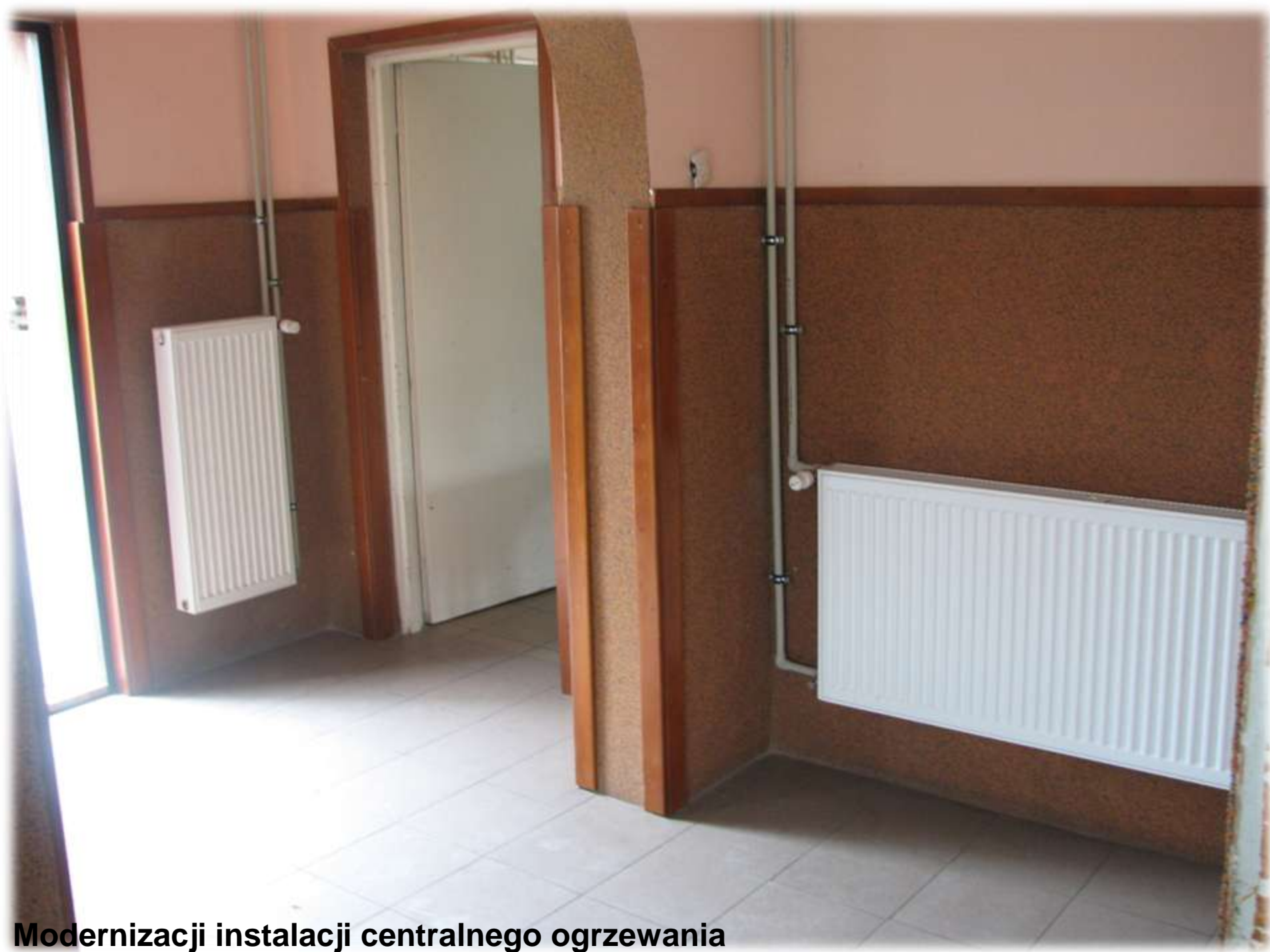
Modernizacji instalacji centralnego ogrzewania