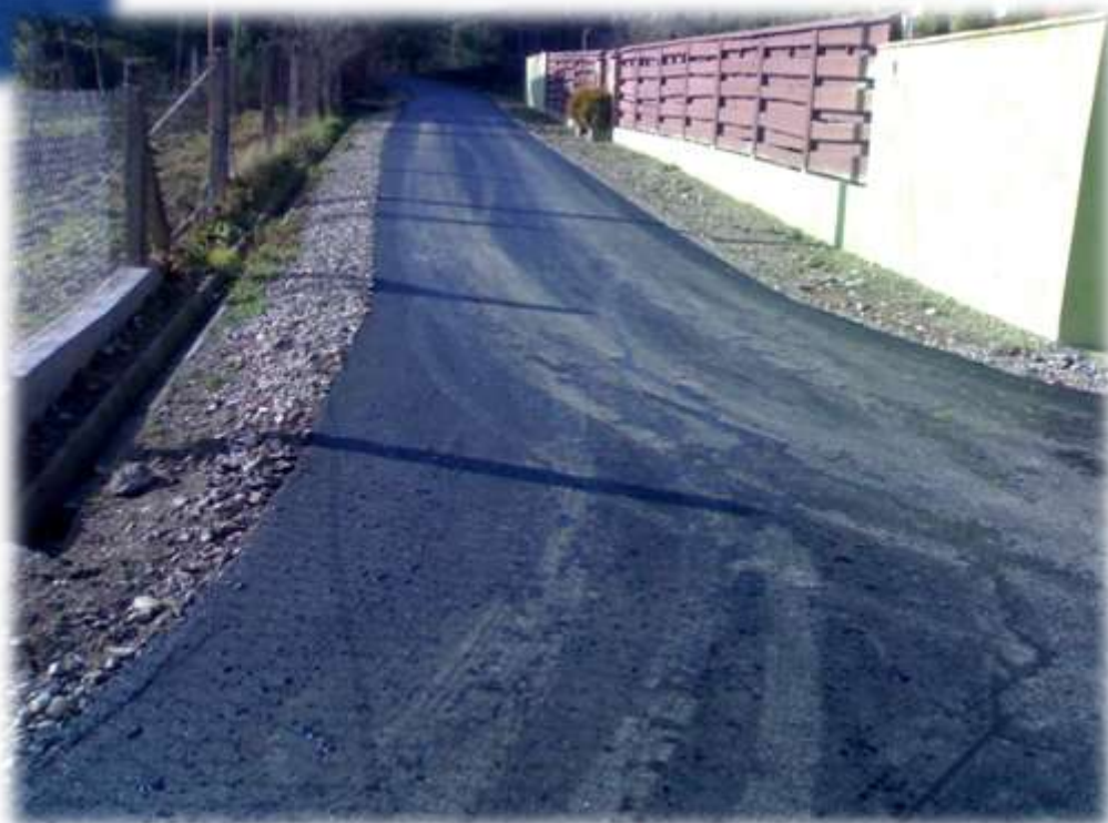
Droga - Stancin