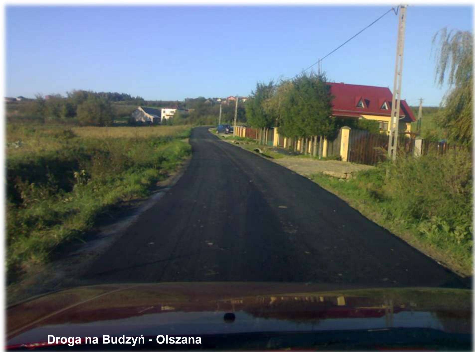
Droga na Budzyń - Olszana