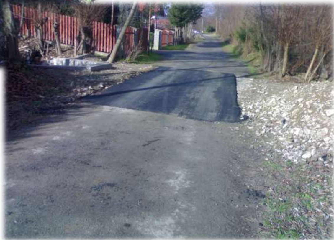
Odbudowa przepustu koło Mamali