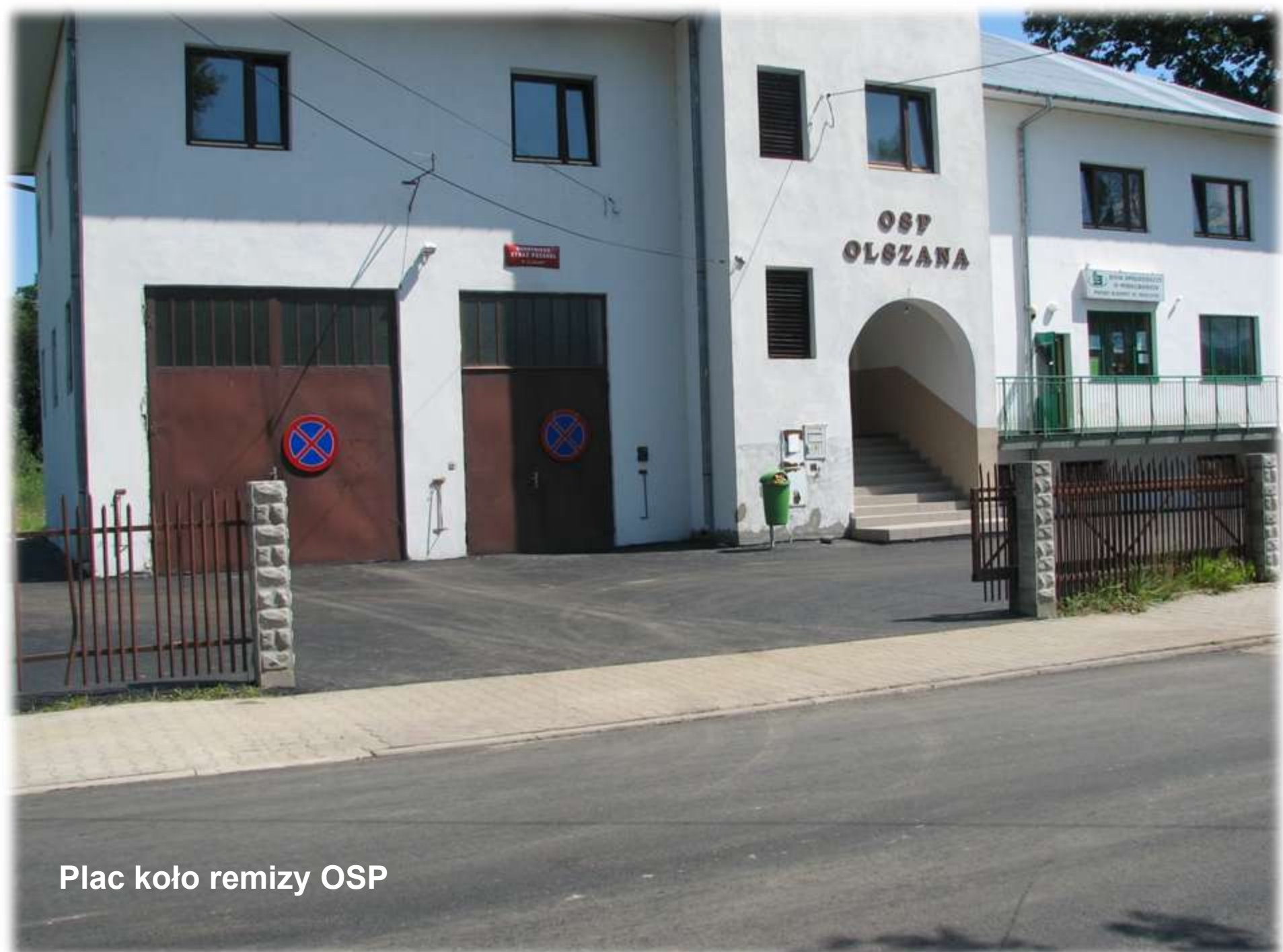
Plac koło remizy OSP