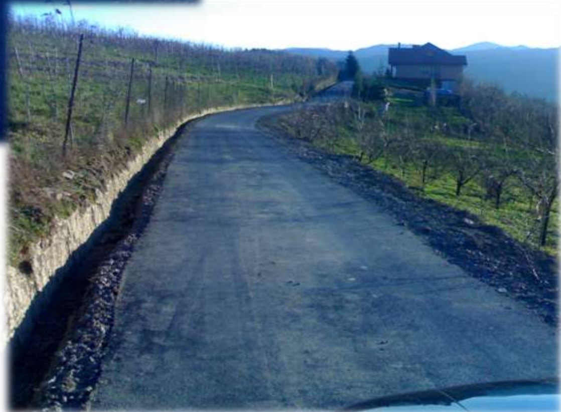
Droga do Matusiewicza