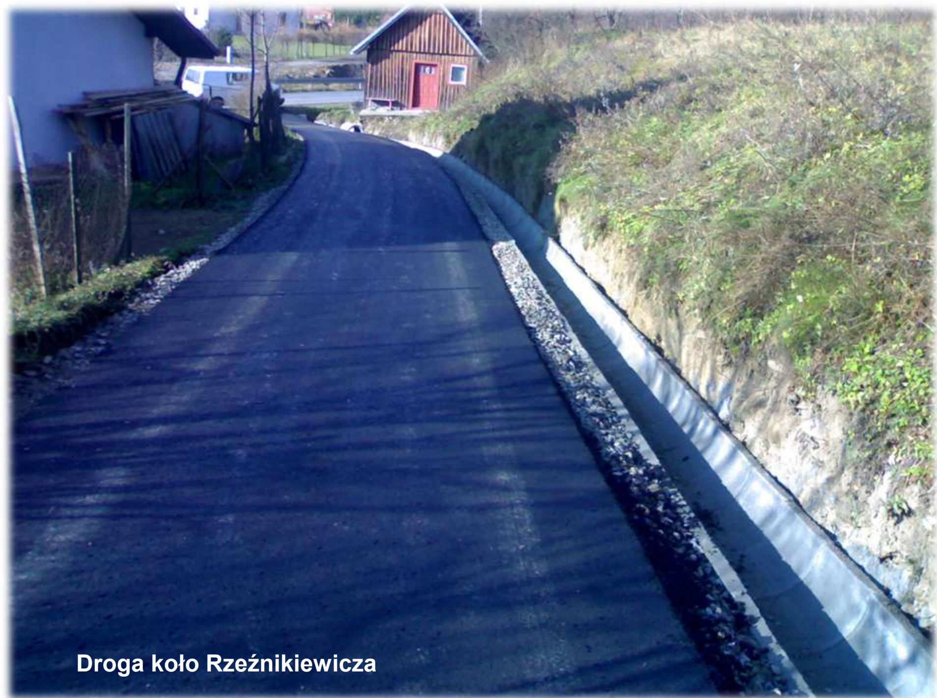
Droga koło Rzeźnikewicza