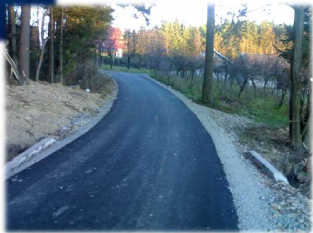
Droga do Kałużnego