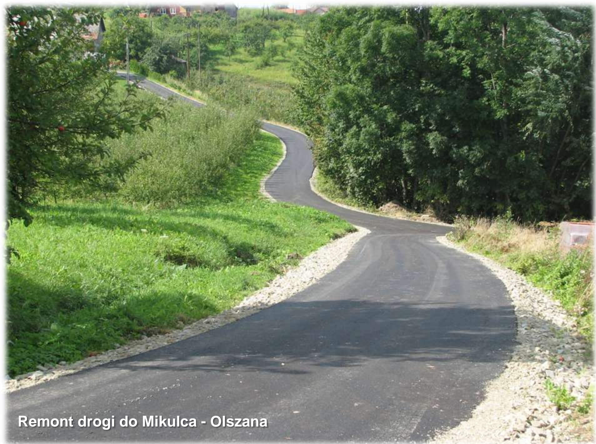
Remont drogi do Mikulca - Olszana