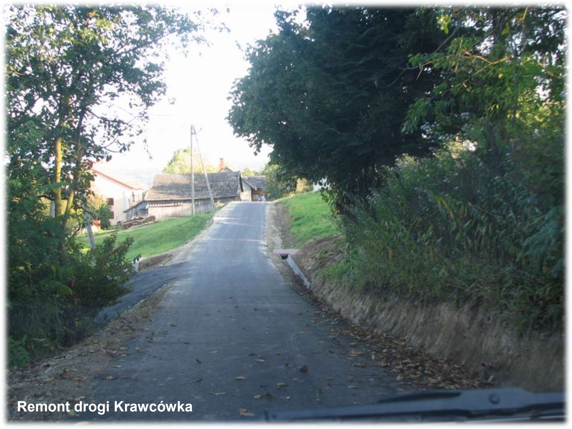
Remont drogi Krawcówka