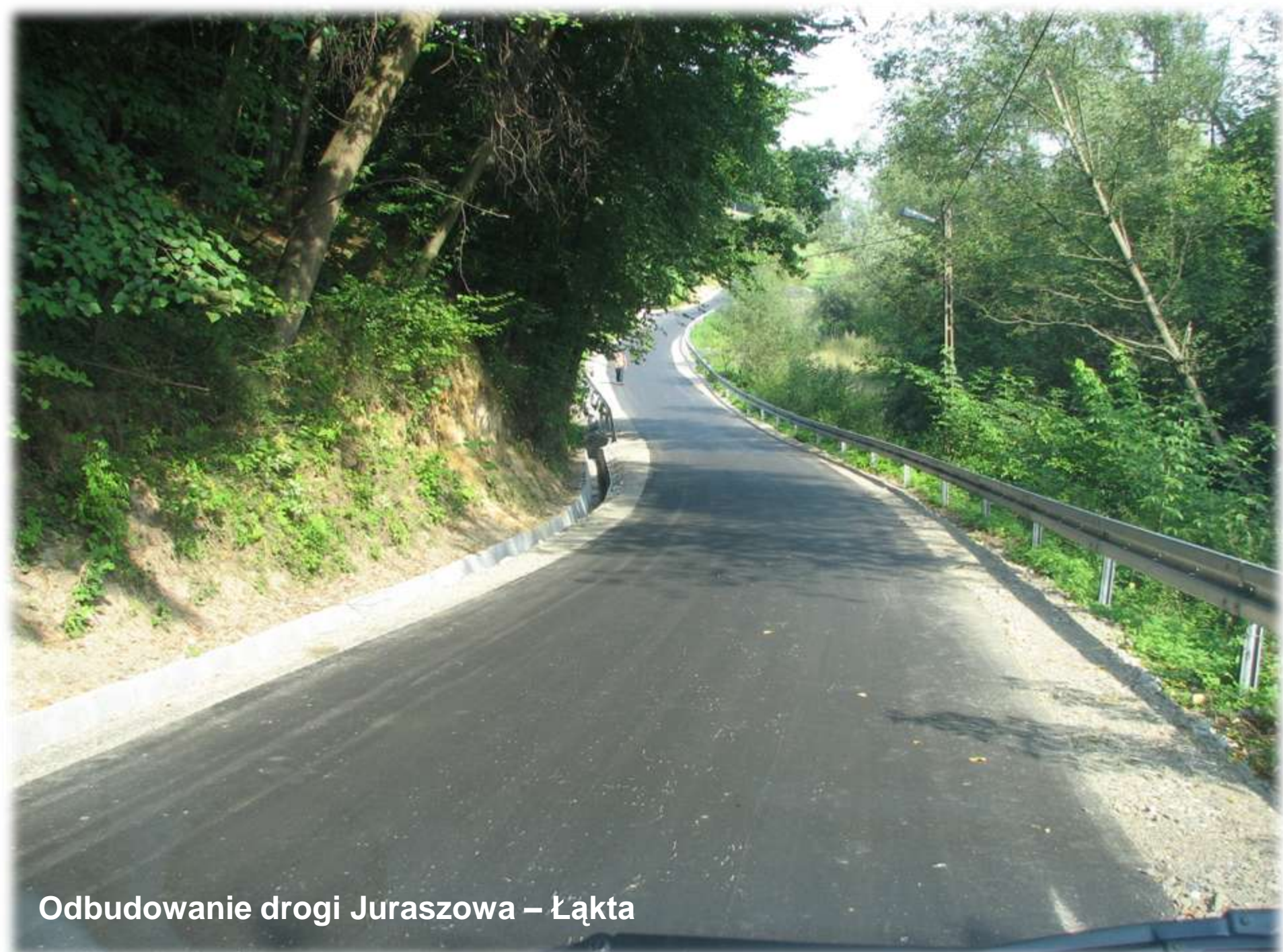
Odbudowanie drogi Juraszowa – Łakta