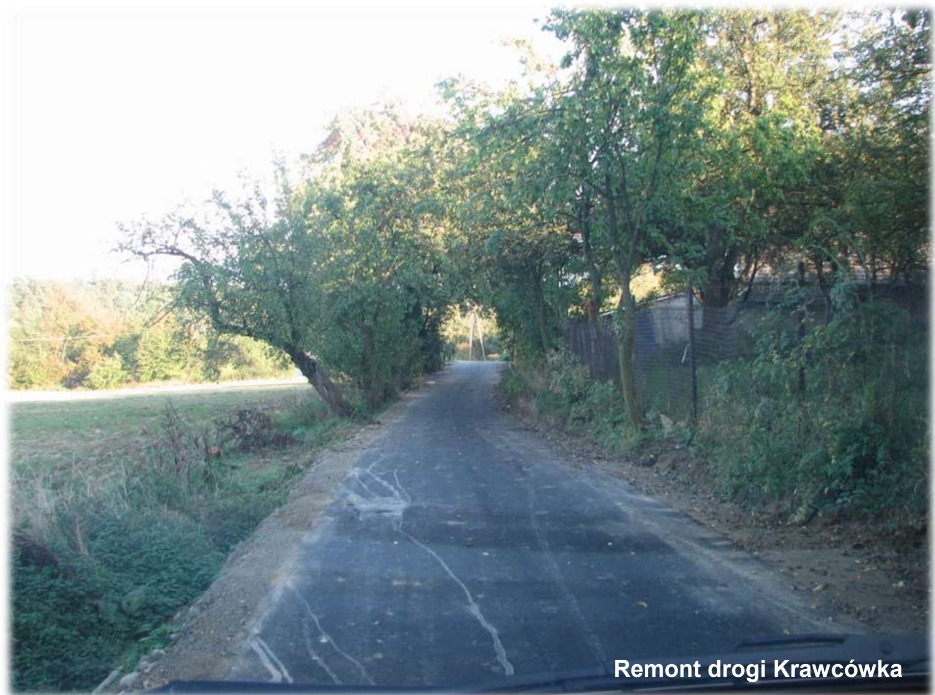
Remont drogi Krawcówka