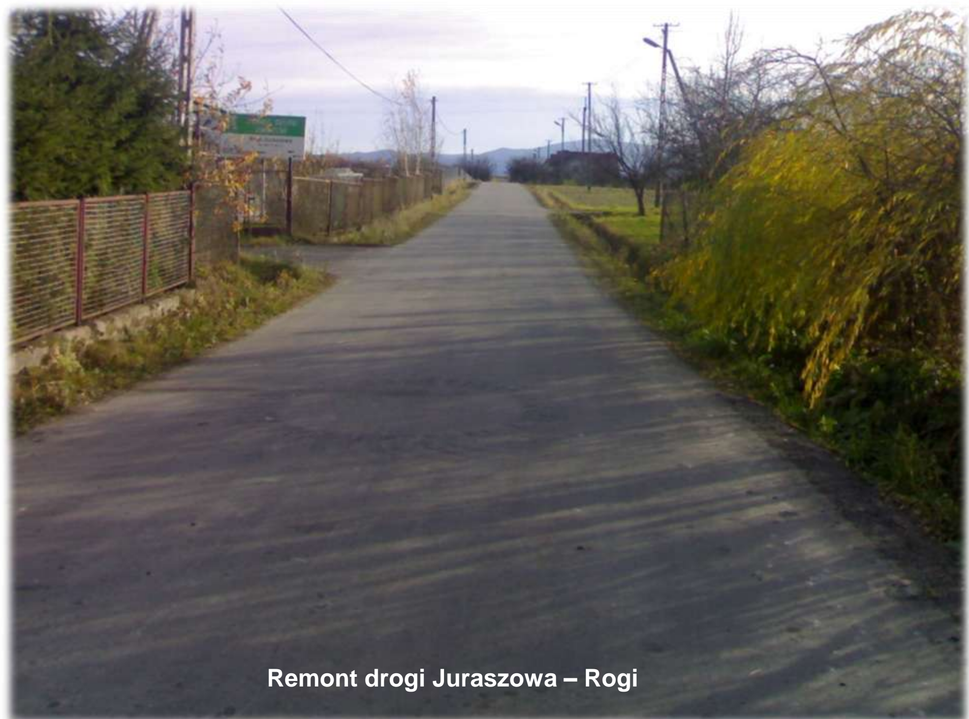
Remont drogi Juraszowa – Rogi